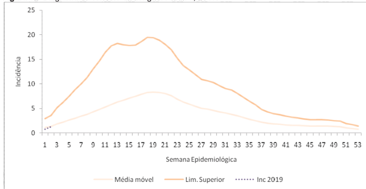
Figura 02 Diagrama de controle da dengue. Paraíba, 2019.

Dados preliminares sujeitos à alteração